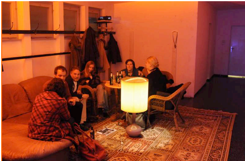
i-camp: Innenansichten - Vorraum (oben), Bar und Foyer (unten).