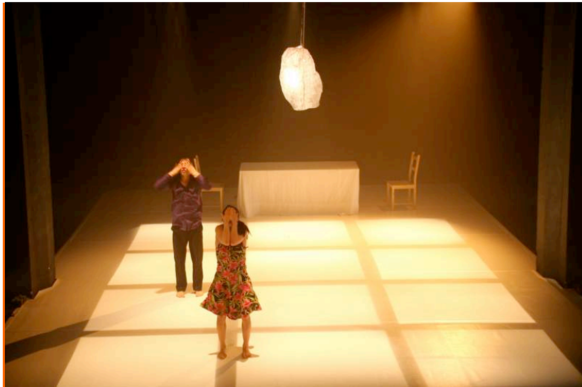
i-camp: Bühne – Tanzperformance der Cie. Elle P Danse (oben), 24h-Performance von Entente Cordiale (unten).