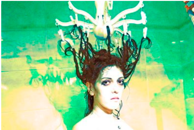
Choreografie „Zerstörung für Anfänger“. Ein Projekt von Mey Sefan.