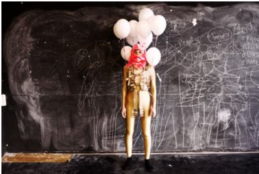
Choreografie „Zerstörung für Anfänger“. Ein Projekt von Mey Sefan.