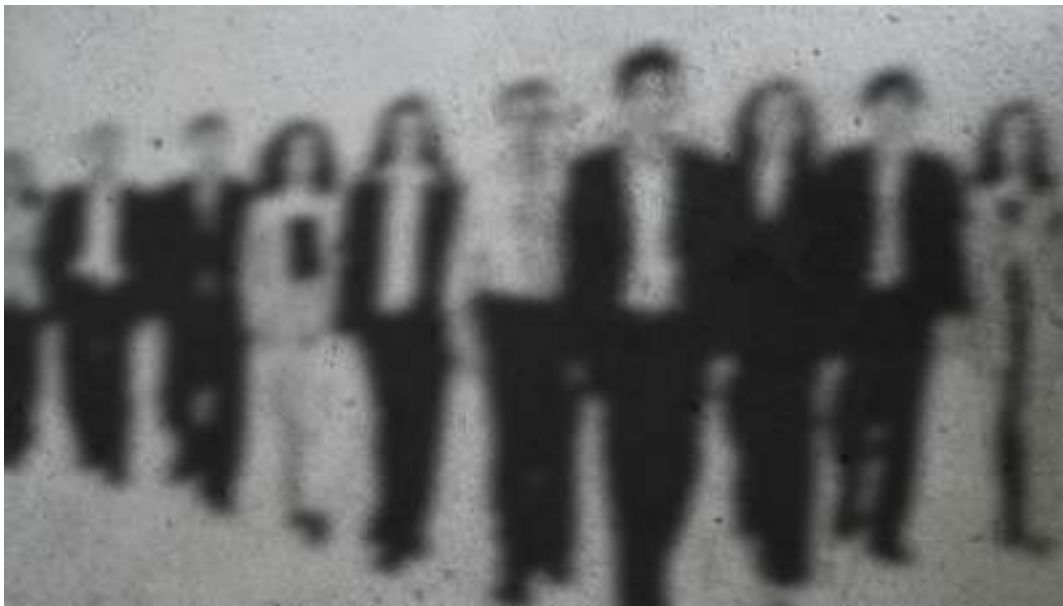
Work With Against – The Flexible Zombie Pop Project. Bildnachweis / Copyright: Ralph Drechsel. Abdruck gegen Nennung honorarfrei.