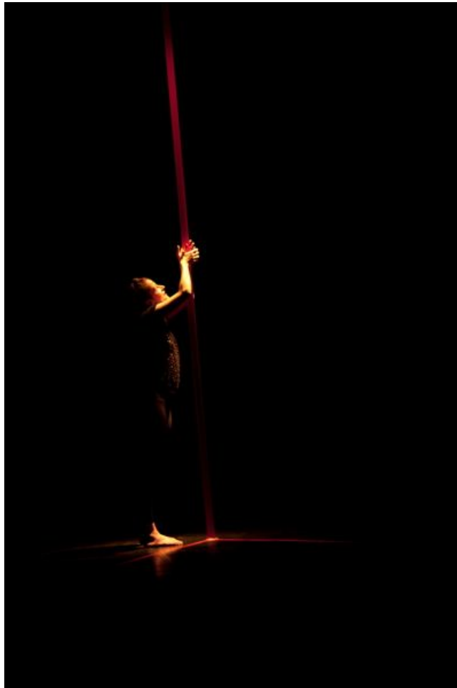
Géraldine Chollet (Tanz) in Jasmine Morrands Solo „Perspective(s) d'une existence fictive“

Premiere: 14. Juni 2013, 20:30 Uhr i-camp/neues theater münchen