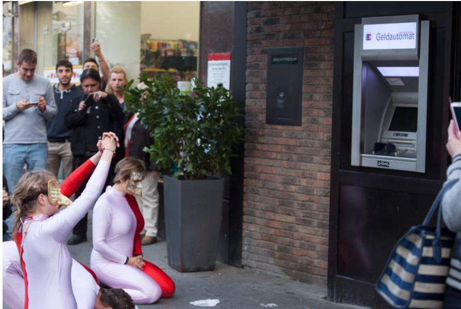
Premiere „Operationsfeld Nichtstaat – Wir sind nur ein Karnevalsverein“: Zeichen für die Abhängigkeit von Geld_ - HG betet den Geldautomaten an. Copyright: Bernd Lindig. Abdruck gegen Nennung honorarfrei.