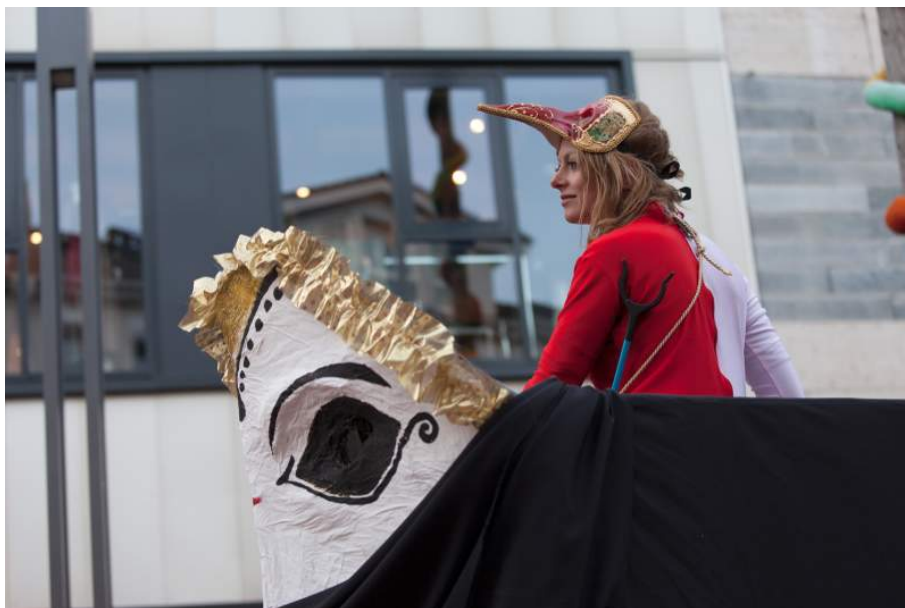
Premiere „Operationsfeld Nichtstaat – Wir sind nur ein Karnevalsverein“: Auf dem Karnevalswagen. Copyright: Bernd Lindig. Abdruck gegen Nennung honorarfrei.