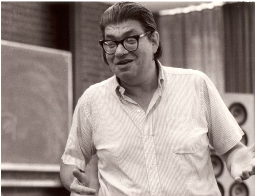
Morton Feldman (1984).