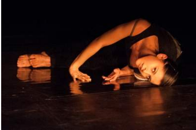
Deutschland-Premiere „Objects of research“ von Petra Fornayová. Bildnachweis / Copyright: LeaLoviskova . Abdruck gegen Nennung honorarfrei.

Deutschland-Premiere: 7. Dezember 2014, 20:30 Uhr i-camp/neues theater münchen